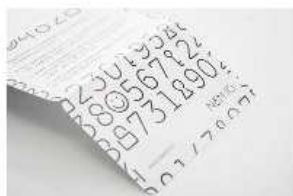
Log på med NemID-nøglekort

OBS: Hvis du ikke kan logge på med dit NemID kan det skyldes, at der ikke er tilknyttet en offentlig digital signatur til dit NemID. På www.NemID.nu kan du finde en vejledning til hvordan du får tilknyttet en offentlig digital signatur. Vejledningen hedder "NemID til andet end banken" (se nedenfor). Gå herefter videre til næste punkt eller start ved punkt 1 igen.